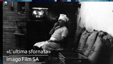
«L'ultima sfornata» Imago Film SA