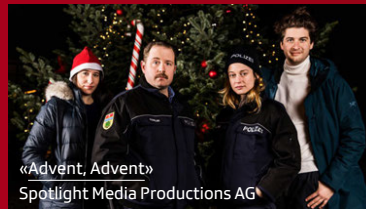
«Advent, Advent» Spotlight Media Productions AG