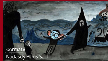
«Armat» Nadasdy Films Sàrl