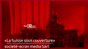
«La Suisse sous couverture» société-écran media Sàrl