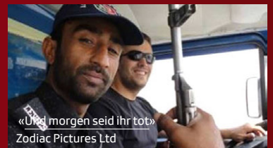
«Und morgen seid ihr tot» Zodiac Pictures Ltd