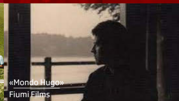
«Mondo Hugo» Fiumi Films