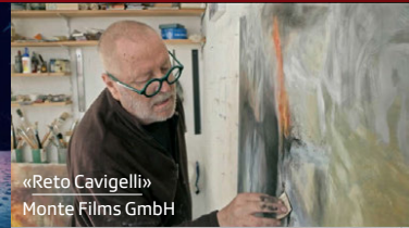
«Reto Cavigelli» Monte Films GmbH