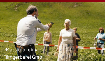
«Metta da fein» Filmgerberei GmbH