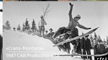
«Crans-Montana» 1987 CAB Productions SA