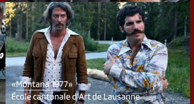
«Montana 1977» École cantonale d'Art de Lausanne