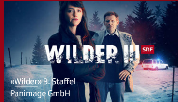
«Wilder» 3. Staffel Panimage GmbH